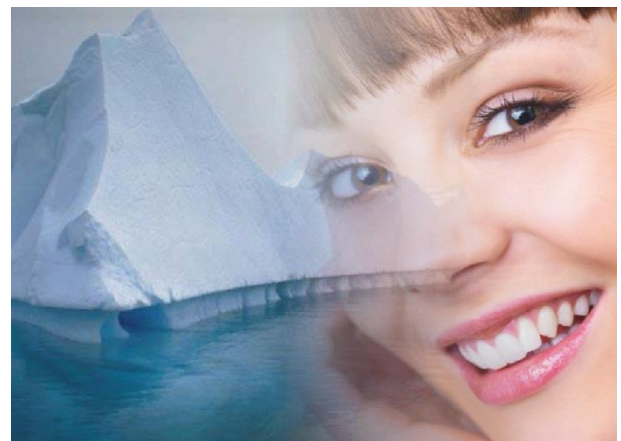
Studien des Herstellers belegen die faltenreduzierende Wirkung von Antarcticine ® .

Gewonnen wird Antarcticine ® aus Bakterien, die im Eis der Antarktis auf King Georg's Island heimisch sind. Nach mehrjähriger Forschung konnten verschiedene einzigartige Wirkstoffe der Bakterien untersucht und für die Kosmetik nutzbar gemacht werden.