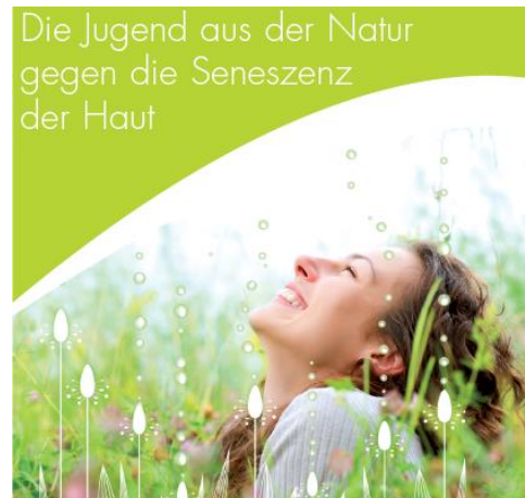
Studien des Herstellers belegen die Wirksamkeit von Senestem ®

Mit modernster patentierter Technologie werden wertvolle biologisch aktive Substanzen aus Spitzwegerichpflanzen extrahiert.